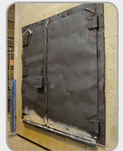
Brandseite nach der Prüfung